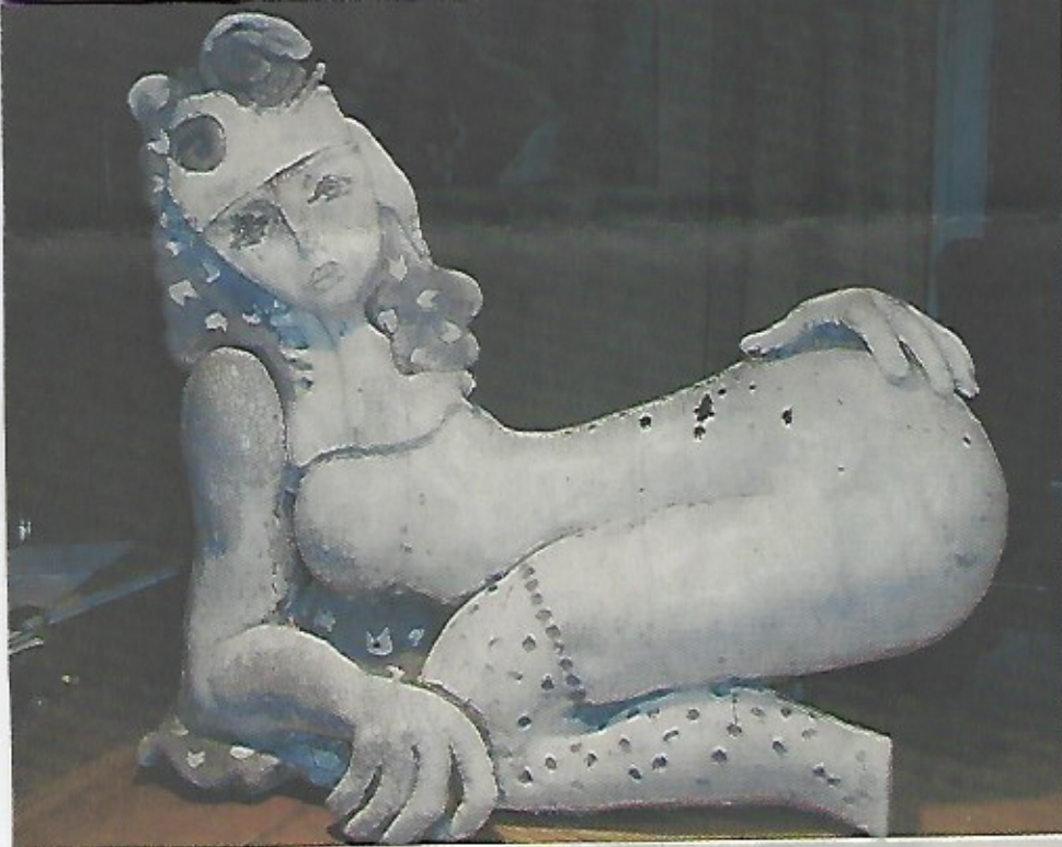
„Frau mit Netzstrümpfen“ heißt diese Keramikfigur des Günzburger Künstlers Roland Bögner mit Rakuglasur und Craqueléstruktur. Die Größe: 55 Zentimeter hoch, 57 Zentimeter breit, 3-Zentimeter tief.